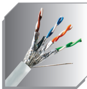
数字通信对绞电缆